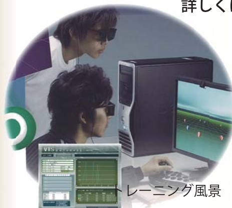
トレーニング風景